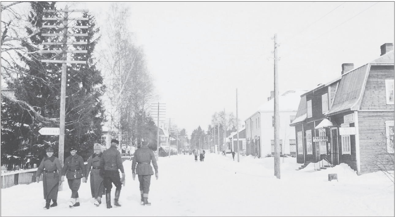
Keuruun keskustaa sotatalvena 1940.

kityiksi ja tallennetuiksi. Tiedän, että siitä tarinavirrasta tavoitetaan ehkä vain osa, mutta sekin on hyvä.