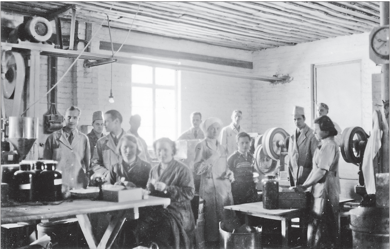
Työntekijöitä ja työnjohtoa Keuruun Sukan tehtaalla 1940.

Niin ihanaa ja mukavaa kirkkoreissua en ole enää sen jälkeen koskaan saanut, että olisi ollut niin paljon ihmettelemistä.”