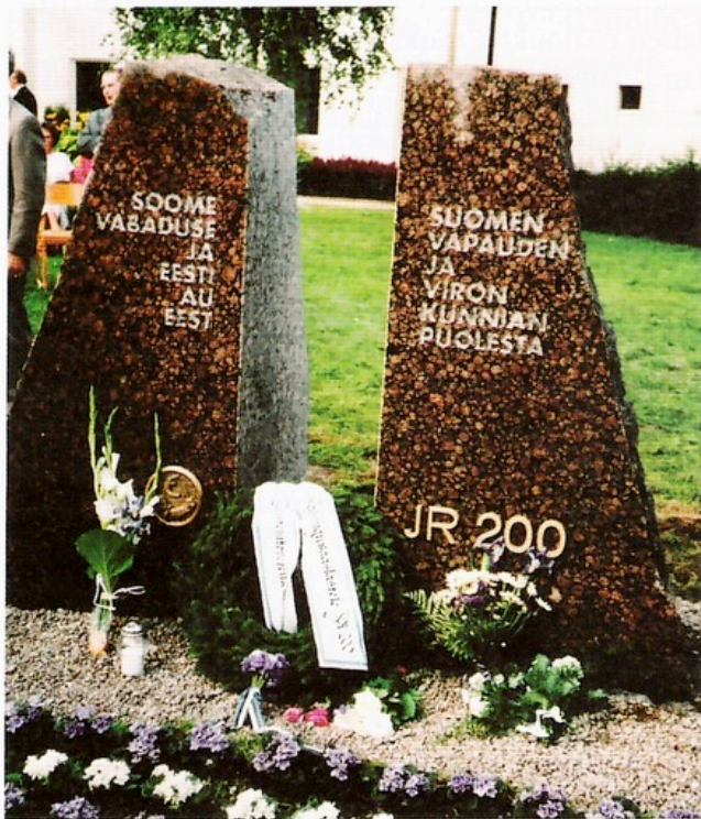
JR 200 muistomerkki paljastettiin Luumäen Taavetissa vuonna 1991.